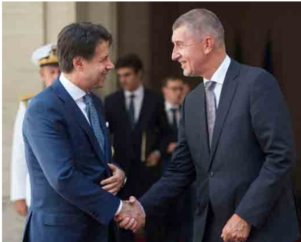
Conte con il primo ministro della Repubblica Ceca Andrej Babis

Naturalmente, come molte iniziative che attirano finanziamenti e comunque muovono soldi, è giusto