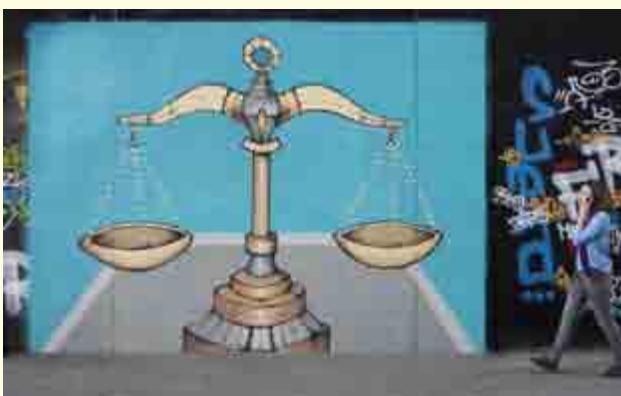
graffito di Thomas Dechoux, illustrante una delle dieci priorità politiche della Commissione Juncker (Giustizia e diritti fondamentali).

Tale asserto si appalesa in controtendenza col passato, poiché, precedentemente, sullo Stato emittente verteva il solo potere di fissare un obiettivo da raggiungere, mentre, allo Stato di esecuzione, era demandata la scelta delle modalità attuative.