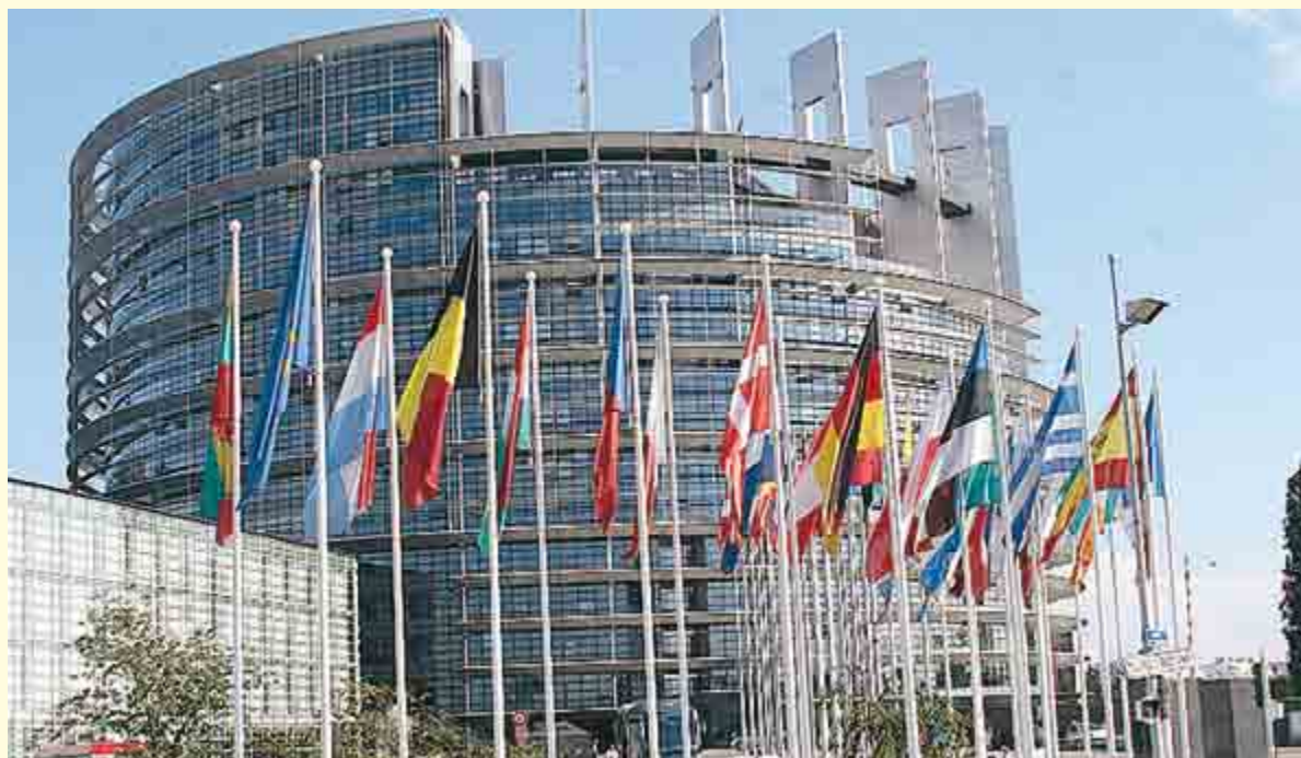
La Sede del parlamento europeo a Bruxelles

zione... L'attenzione mediatica e legislativa peraltro tende presto ad affievolirsi, in attesa di una nuova “emergenza...”. In ogni caso, una considerazione abbastanza diffusa è che il sistema di contrasto alla corruzione sia piuttosto efficiente sotto il profilo dell'attività investigativa ed inquirente, pur considerando che si tratta di comportamenti per i quali è particolarmente alto il cd. “numero oscuro” (P. Martucci, La criminalità economica , Bari, 2006,