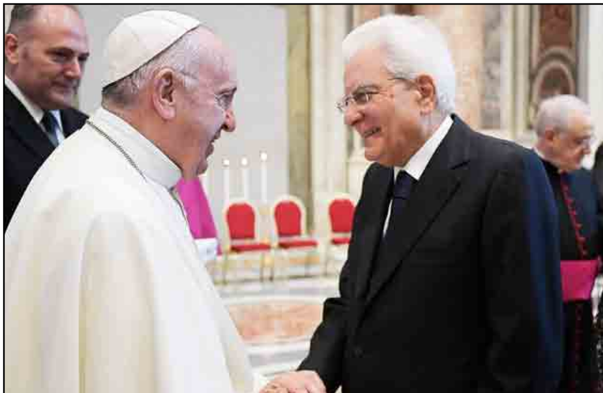
Papa Francesco e Mattarella in Vaticano l'ottobre scorso