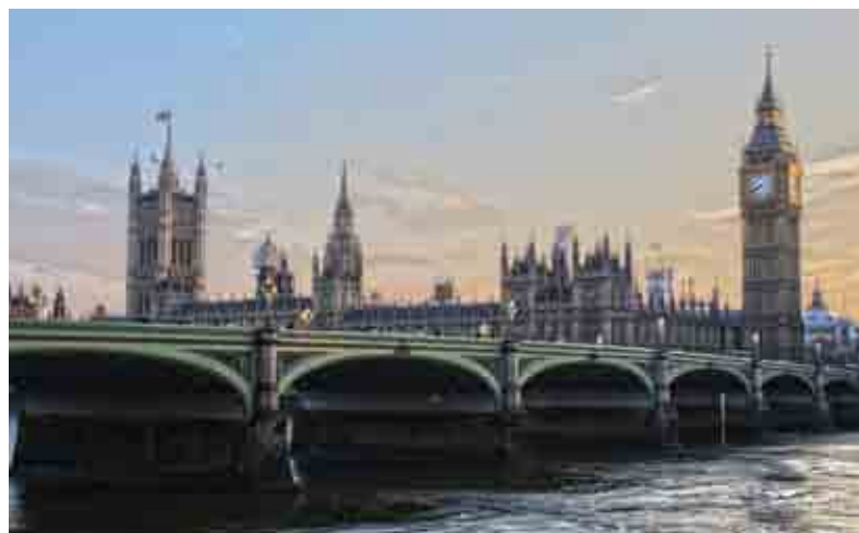
Una veduta di Londra

essere espliciti -, risulta nettamente primo nelle intenzioni di voto, a quota 27% (i conservatori, alla guida del governo, sprofonderebbero al 15, i laburisti sarebbero seconda forza al 22%).