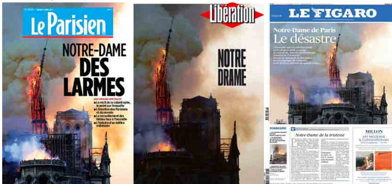
Il dramma dell'incendio di Notre-Dame nei quotidiani francesi del giorno dopo