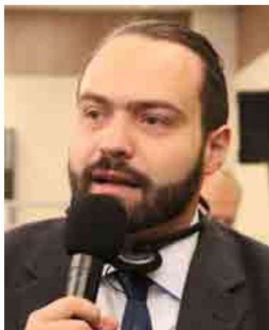
Fabio Massimo Castaldo

Tornando ai singoli eurodeputati produttivi, vanno segnalate le ottime performance degli italiani nella graduatoria generale di tutti i 751 componenti del Parlamento. Castaldo (M5s) è il quinto in assoluto per dichiarazioni in Aula e il settimo per i report presentati (dove sventa