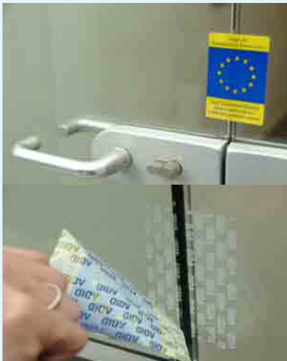
Gli speciali sigilli apposti dai controllori della Commissione Europea dopo ispezioni a sorpresa effettuate alle imprese nel quadro di indagini anti-trust. In caso di rimozione, la parola indelebile “VOID” appare dove erano stati apposti.

“Penso che viviamo in un tempo di grande cambiamento tecnologico, economico di società e ciò, come sempre, ha come conseguenza, nella gente, delle preoccupazioni. E penso anche che bisogna rendersi conto che i vantaggi e gli inconvenienti dello sviluppo non sono sempre distribuiti