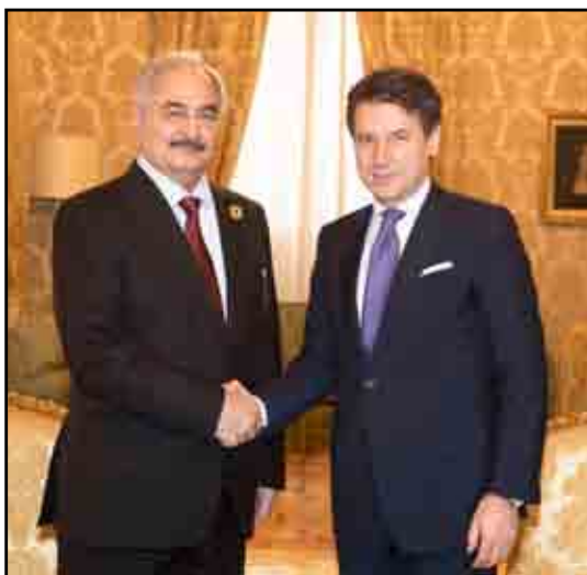
Conte con Haftar

Ma il conflitto, che covava già sotto la cenere da anni, ora è esploso. Con inevitabili ripercussioni in Europa, dove il "conflitto diplomatico" è tra Italia e Francia.