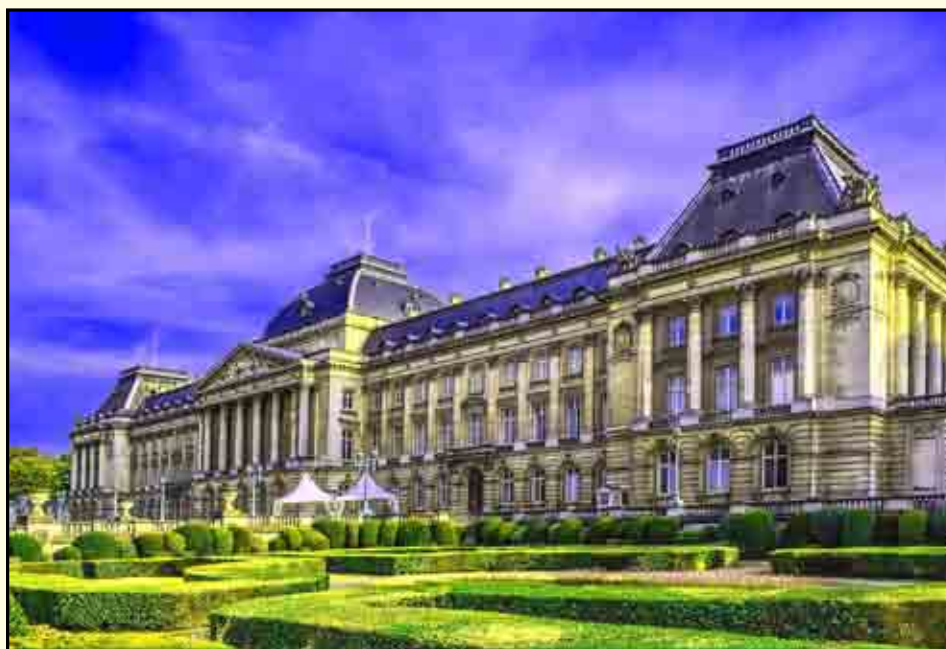
Palazzo Reale di Bruxelles

confisca del profitto o del prodotto diretti, (c.d. “confisca per equivalente”) anche nel caso di definizione del giudizio con il rito del patteggiamento.