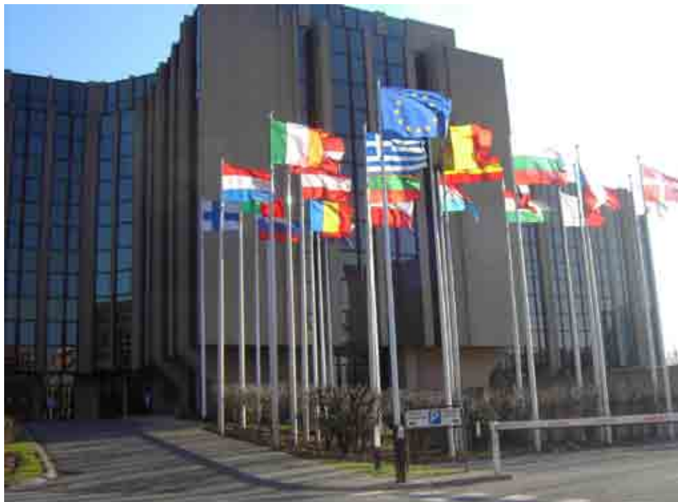
La Corte europea dei Conti a Lussemburgo

The situation has not changed fundamentally after almost three decades! European money is still considered 'res nullius' instead of 'res omnium'. National prosecutors tend not to give the same level of priority to cases where the damage is to the EU interests as where national interests are concerned. The greater difficulty of investigating European fraud cases, the low public interest, the length of time involved and the low probability of outcome are still invoqued. This leads to a very poor conviction rate in the Member States.