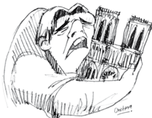
Quasimodo che abbraccia Notre Dame nel disegno di Cristina Correa Freil diventato virale nei social

Naturalmente, anche un dramma così va raccontato in un contesto.