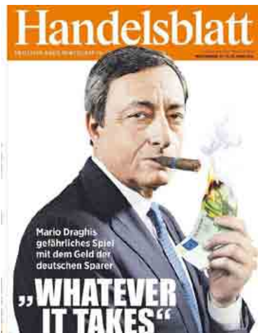
Mario Draghi uomo-copertina della stampa internazionale

barba allo scetticismo dei membri più "rigoristi" del board di Francoforte. "Quello che ha fatto oggi il consiglio direttivo - ha spiegato Draghi a chi gli chiedeva del 'bazooka' - è una valutazione delle prospettive economiche" e "riasserire la prontezza della Bce a usare ogni strumento possibile per far fronte a qualsiasi contingen-