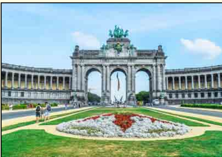
Parco del Cinquantenario a Bruxelles

La sentenza ha deciso in merito ad un rinvio pregiudiziale, proposto ai sensi dell'articolo 267 TFUE, dal Rechtbank Noord-Nederland (Tribunale dei Paesi Bassi settentrionali), nell'ambito di un procedimento penale, con riferimento all'interpretazione dell'articolo 12, della decisione quadro 2006/783/GAI ( Giustizia Affari Interni ) del Consiglio, del 6 ottobre 2006, relativa all'applicazio-