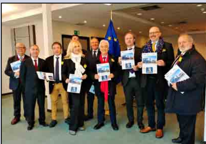
Più Europei a Bruxelles

zazione del Consiglio UE. La prima lettura del provvedimento è passata con 339 voti favorevoli, 205 contrari e 62 astensioni. Le ulteriori azioni saranno di competenza del nuovo Parlamento.