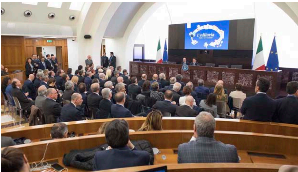
Gli Stati generali dell’Editoria a Roma

nalisti come iscritti. E potrebbe esserci un giorno un presidente dell’Inpgi che non è giornalista? “Eventuali cambiamenti nella governance non sono immaginabili adesso – risponde Macelloni -. Ma se entrano 13mila persone e noi siamo sessantamila mi pare difficile che la presidenza vada al rappresentante dei 13mila”. In realtà quelli che contano sono gli iscritti all’Inpgi 1 che sono attorno ai 25mila, di cui circa 15mila sono gli iscritti attivi, gli altri pensionati. In sede elettorale, sono questi i numeri che contano, e non certo gli iscritti all’Inpgi 2. Infatti lo Statuto prevede che su 62 componenti elettivi del Consiglio generale 50 siano in rappresentanza degli attivi e 10 dei pensionati. E con il calo costante degli iscritti non è improbabile che i “comunicatori” attivi (che già sono quasi quanto i giornalisti attivi) diventino la parte più numerosa in Inpgi 1. Ma certo questo, per chi pensa che sia un problema, è un problema lontano.