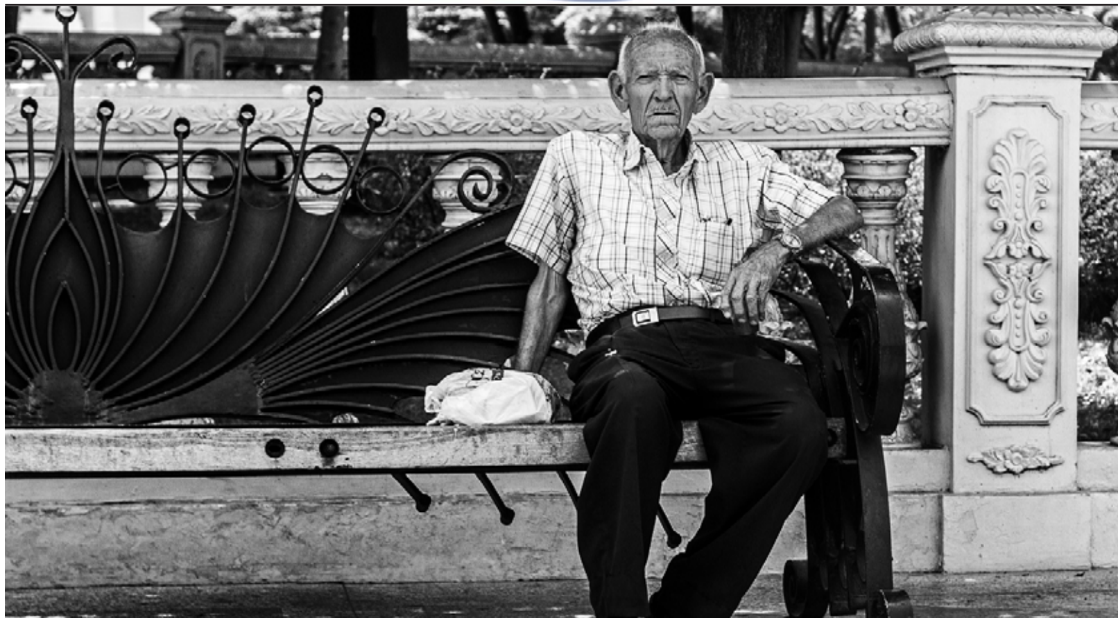
Anziano a Maracaibo, la seconda città del Venezuela dopo la capitale Caracas