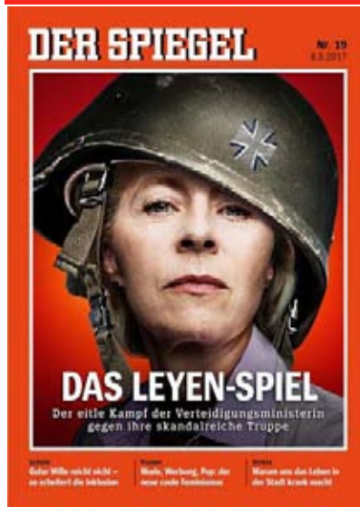
Ursula von der Leyen in copertina, da ministro della Difesa in Germania a Presidente della Commissione europea