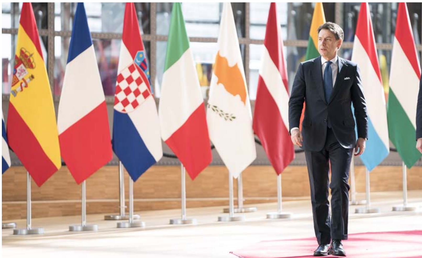
Il Primo ministro Giuseppe Conte a Bruxelles

denza i leghisti avrebbero provato a forzare la mano, chiedendo alla von der Leyen - in cambio del voto - un commissario in un ruolo chiave. Lei ha avuto probabilmente buon