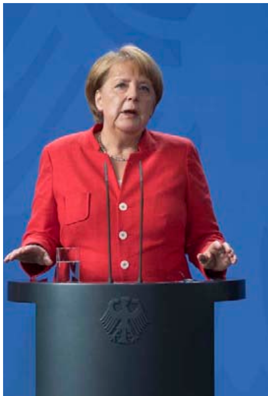
che Angela Merkel

Il primo riguarda il tema sempre d'attualità dei migranti. "I salvataggi in mare non sono solo un obbligo, ma un comando e un atto umanitario" è il principio che sottolinea. Apprezza che von der Leyen abbia detto di voler correggere gli «errori di costruzione delle regole di Dublino» (il trattato che