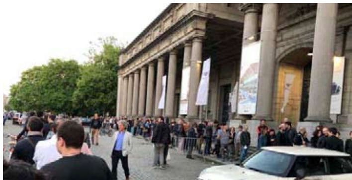
La fila a Bruxelles alle elezioni europee degli italiani residenti

"Il ministero ha ridotto sensibilmente il numero dei seggi elettorali all'estero rispetto alle europee 2014: in alcuni paesi, come il Lussemburgo, fino alla metà. Di conse-