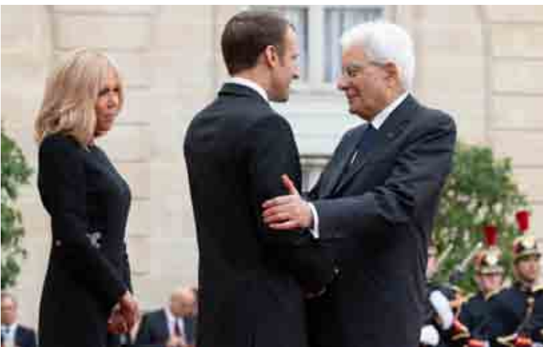
Brigitte ed Emmanuel Macron salutano Mattarella ai funerali di Chirac

sull'Albania). Ma basta anche un solo "no" nel Consiglio dei capi di governo e di Stato dell'Unione per bloccare tutto. "Non si trattava di dire sì o no a Macedonia e Albania per l'adesione, ma sì o no ad iniziare i negoziati", ha commentato il Presidente uscente della Commissione europea, il lussemburghese Jean-Claude Juncker, che ha aggiunto: "È stato un grave, pesante, errore storico".