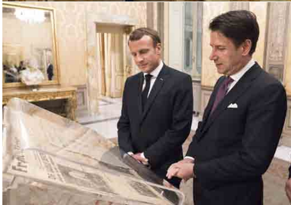
Macron e Conte a Palazzo Chigi

quota pari allo 0,90%. Uno schema del genere comporterebbe una spesa maggiore per Germania e Olanda, tra gli altri. Mentre l'Italia, che è appena al di sotto della media Ue in quanto a Reddito nazionale lordo, ne potrebbe trarre dei vantaggi. Il presidente francese Emmanuel Macron ha puntato il dito contro Berlino, con cui ha divergenze riguardo all'apertura dei negoziati di allargamento per Albania e Macedonia del Nord. "Gli stessi che ci dicono di voler allargare affermano di volere un