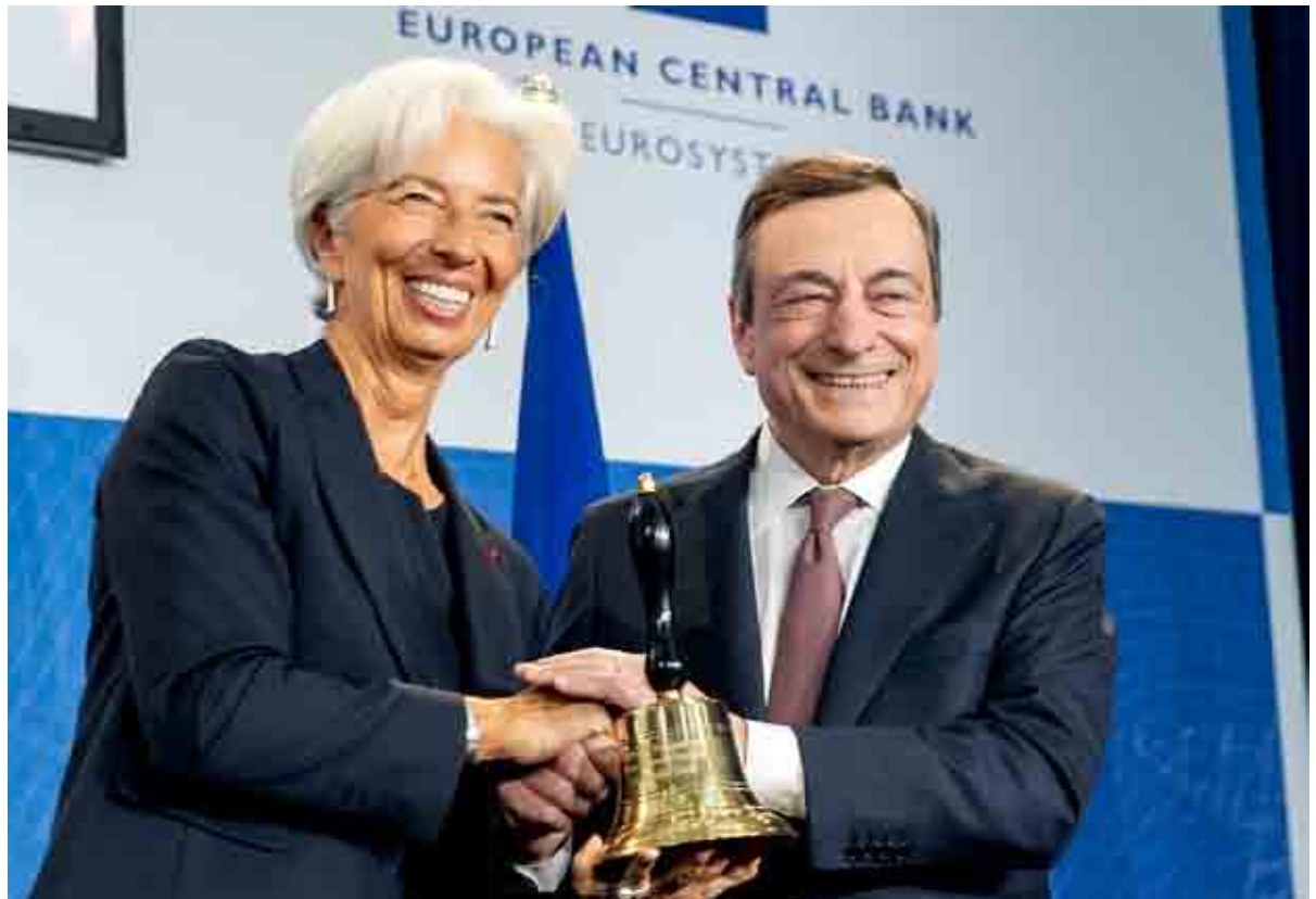
Christine Lagarde con Mario Draghi e il simbolico passaggio delle consegne a Francoforte

In questo quadro, l'Italia che ha cambiato coalizione di governo, si trova ad affrontare una manovra dal peso esagerato di trenta miliardi di euro che - per evitare l'aumento automatico dell'Iva - prova a trovare risorse con nuove tasse e altri tagli. Roma è sempre sotto osservazione, perché il suo rapporto debito pubblico/prodotto interno lordo - che è l'indicatore di salute economica più osservato da Bruxelles - è al 132,2%. Febbre alta. E se molti interventi della Bce in questi anni hanno aiutato la nostra economia non si può serenamente dire che Francoforte non abbia fatto contemporaneamente gli interessi generali dell'Eurozona. L'eredità lasciata da Draghi non è affidata solo a chi prenderà il suo posto (Christine Lagarde, 63 anni, per altro ha una formazione diversa, è un avvocato) ma ai governi europei, alle riforme necessarie per essere al passo delle sfide già attuali, alla loro politica economica. Il suo motto resterà quel