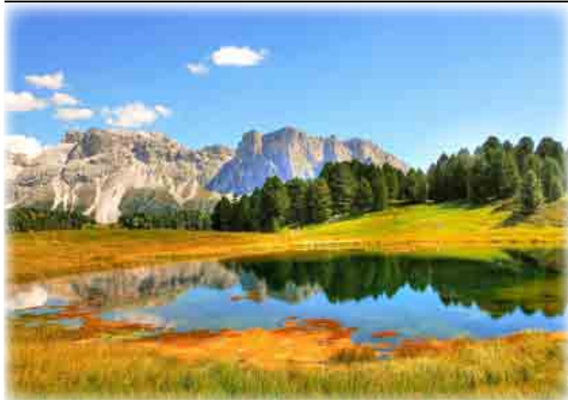
La natura dell'Alto Adige