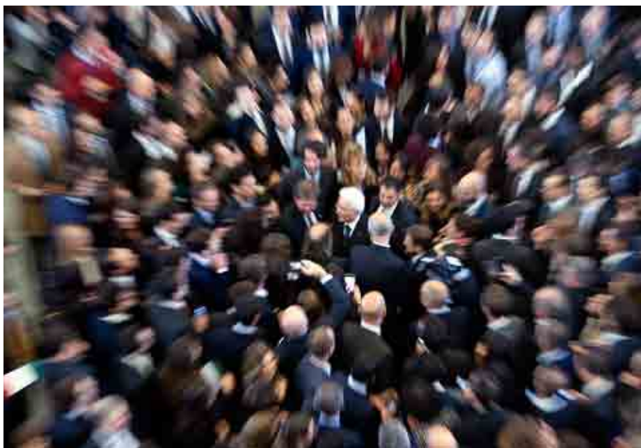
Il Presidente Mattarella il 28 ottobre a Francoforte

Vorrei far mie queste affermazioni perché nell'Unione risiede la tutela della sovranità dei paesi europei. La quantità e la qualità dei passaggi e degli interventi necessari per far fronte alla nuova condizione internazionale ha bisogno di un ulteriore e responsabile "cambio di passo", al quale non può essere estraneo il Parlamento Europeo, espressione dei popoli europei. Dobbiamo, tutti, avere coraggio. Non credo sia stato facile per il Presidente Draghi, nel pieno della crisi, affermare: "whatever it takes". Tutto ciò che è necessario, finché è necessario, per il bene dell'Europa e delle generazioni future. È quel che dobbiamo tutti assolutamente fare. Professor Draghi, caro Mario, come cittadino europeo desidero dirle grazie.