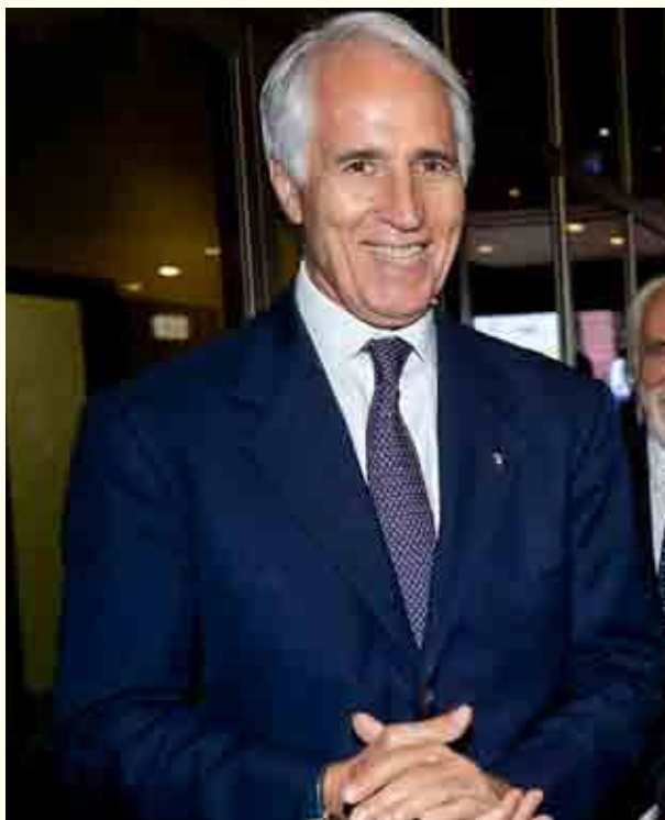
Giovanni Malagò presidente del Coni

in particolare la loro collocazione nell'aggregato "amministrazioni pubbliche", una delle "unità istituzionali" in cui il SEC 2010 suddivide i settori economici nazionali. Poiché le "amministrazioni pubbliche", secondo quanto previsto dall'art. 1 della legge n. 196 del 31 dicembre 2009 (Legge di contabilità e finanza pubblica), concorrono al perseguimento degli obiettivi di finanza pubblica definiti in ambito nazionale in coerenza con le procedure e i criteri stabiliti dall'Unione europea e ne condividono le conseguenti responsabilità, la loro qualificazione come "amministrazioni pubbliche" comporta particolari obblighi di natura finanziaria e contabile derivanti dal principio del "pareggio del bilancio" in Costituzione i cui alla legge cost. n. 1 del 20 aprile 2012 e della legge 24 dicembre 2012, n. 243 che ha dettato le relative regole applicative. Il concreto interesse delle federazioni sportive a non essere classificate "amministrazioni pubbliche" e quindi a non essere inserite o meno in elenco si collega ai vari provvedimenti restrittivi dell'autonomia di spesa e comunque diretti ad imporre vincoli e controlli contabili e finanziari (es. armonizzazione contabile, criteri e modalità di predisposizione del budget economico delle amministrazioni pubbliche in contabilità civilistica, linee guida generali per