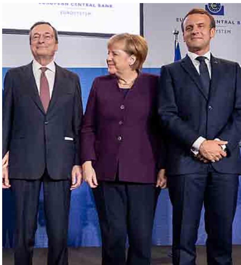
Draghi, Merkel e Macron a Francoforte

mia moglie", aggiungendo: "Lei ne sa più di me". A oggi, l'autorevolezza di Draghi lo fa ritenere probabilmente l'italiano più apprezzato al mondo nel campo della politica (perché politico è, per come ha