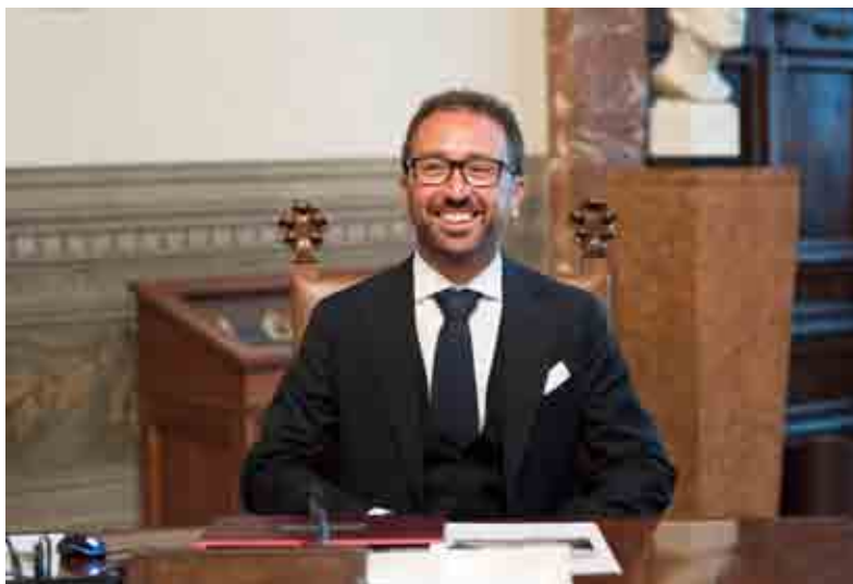
Il ministro della Giustizia Alfonso Bonafede

La Cedu di Strasburgo si era già espressa dando ragione a un boss della 'ndrangheta, Marcello Viola, nel giugno scorso, questa volta riguardo a tutti i benefici possibili in caso di ergastolo "semplice". E poi l'8 ottobre ha respinto come "inammissibile"