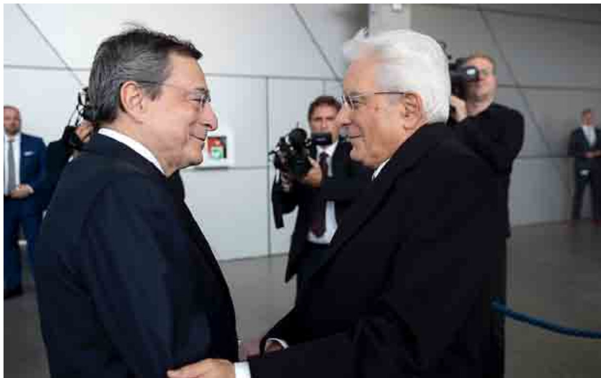
Draghi e Mattarella il 28 ottobre scorso a Francoforte