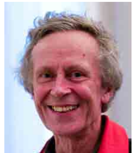
Derrick de Kerckhove

una tematica e di indurre nicchie di persone alla convinzione sempre maggiore della sua importanza". Avviene lo stesso per le opinioni: "Col passare del tempo l'opinione si trasforma in una teoria, con tanto di prove potenzialmente mai verificate, fino a diventare una convinzione". Non solo. Più un argomento tocca la sensibilità personale e scatena rabbia (o entusiasmo), più ci saranno reazioni (quindi più utenti coinvolti), più l'algoritmo -per come è impostato- avrà raccolto il successo sperato. Insomma, se si parla del tempo meteorologico nessuno risponde,