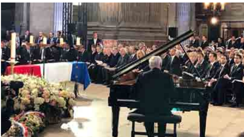
I funerali di Jacques Chirac il 30 settembre scorso a Parigi

C'erano naturalmente gli ex presidenti francesi ancora in vita: Valéry Giscard d'Estaing, Nicolas Sarkozy, François Hollande. C'erano capi di Stato e di governo di tutto il mondo. Ma era assente l'ex cancelliere della Germania Gerhard Schroeder, che pure era stato amico di Chirac e con lui aveva condiviso un'importante stagione politica. «Gerhard Schroeder avrebbe voluto partecipare ai funerali ed essere presente per rendere un ultimo omaggio al