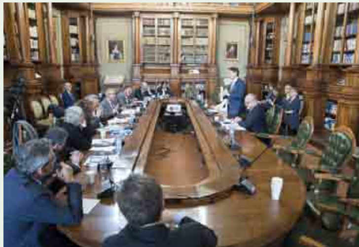
Incontro con i sindacati a Palazzo Chigi con Conte, Catalfo e Gualtieri

Tra le nuove tasse, ci sono quelle sugli imballaggi di plastica non riciclabile (varrebbe un mi-