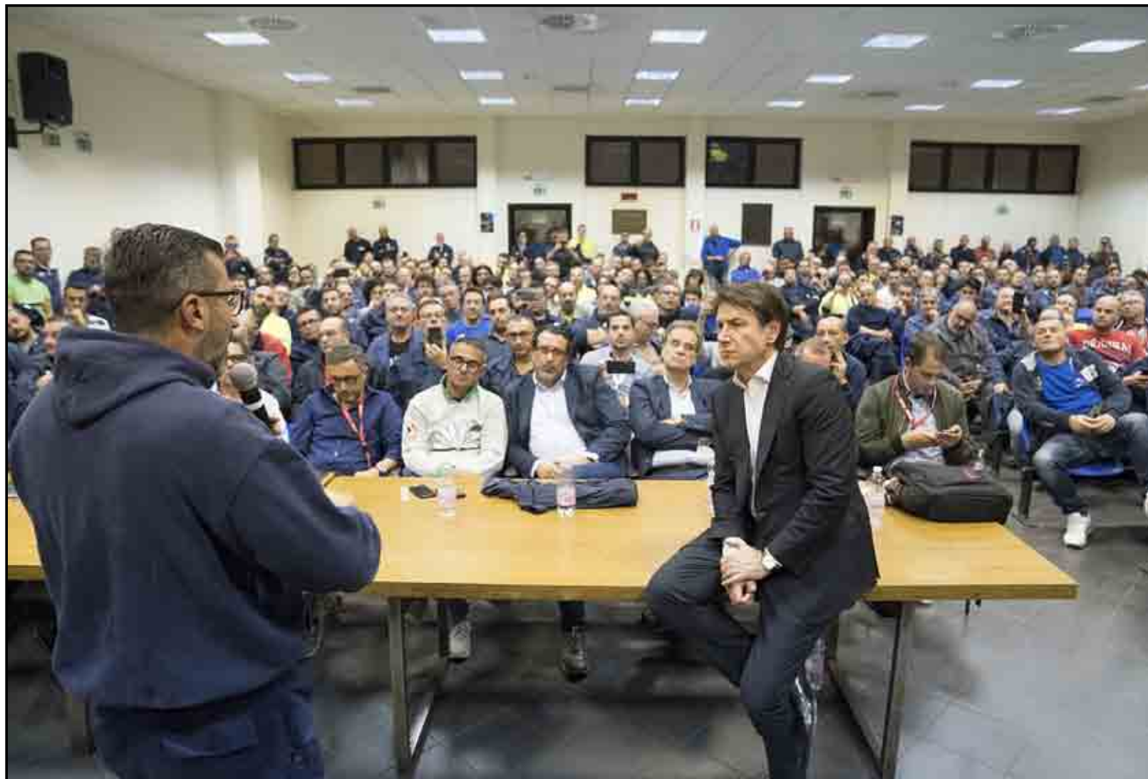
Il primo ministro Giuseppe Conte e gli operai dell'Ilva