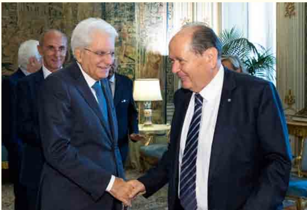
Mattarella e il Presidente della Corte costituzionale Giorgio Lattanzi

tuzionalità), in base alle quali la violazione del ne bis in idem sancito dall’art. 50 CDFUE non si verifica allorché le due sanzioni perseguano scopi differenti e complementari, sempre che il sistema normativo garantisca una coordinazione tra i due procedimenti si da evitare eccessivi oneri per l’interessato, e assicurarsi comunque che il complessivo risultato sanzionatorio non risulti sproporzionato rispetto alla gravità della violazione. La sostanziale coincidenza di tali criteri rispetto a quelli enunciati dalla Corte di Strasburgo è stata espressamente sottolineata dalla Corte di giustizia, che ha richiamato il principio generale, posto dall’art. 52, paragrafo 1, della Carta dei diritti fondamentali UE (cd. Carta di Nizza) dell’equivalenza delle tutele assicurate dalla Carta rispetto a quelle approntate dalla CEDU e dei suoi protocolli. In base agli anzidetti criteri la cit. sent. Menci , ha concluso nel senso che la disciplina italiana in materia di omesso versamento di IVA, riservando la perseguibilità in sede penale alle sole violazioni superiori a