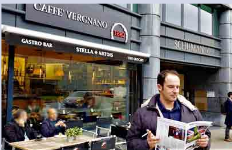
Più Europei a Bruxelles

3.300 denominazioni UE registrate come denominazione di origine protetta (DOP) o come indicazione geografica protetta (IGP). Gli accordi bilaterali, come quello in corso con la Cina, hanno portato nell'UE 1250 denominazioni protette di paesi terzi.