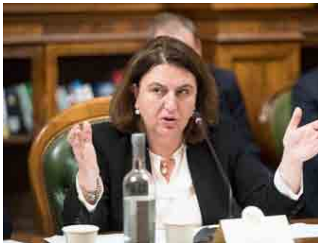
Nunzia Catalfo, ministro del Lavoro

Non esattamente. Quest'estate alcuni leader politici hanno attribuito a vari partiti (non i propri, sempre gli "avversari") la responsabilità di questa sorta di ghigliottina sui nostri conti pubblici. In una lettera a Italia Oggi Giulio Tremonti, nel 2011