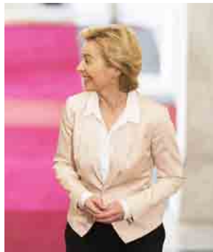
Ursula von der Leyen

sentate nei vertici aziendali rispetto agli uomini. "Le posizioni lavorative di gestione e supervisione sono ricoperte in larga maggioranza da uomini", mette infatti in luce nel suo più recente report sulle disuguaglianze la Commissione europea. "Gli uomini ricevono più promozioni rispetto alle donne, in tutti i settori, di conseguenza vengono pagati di più - osserva il report di Bruxelles -. Questa tendenza raggiunge il culmine ai livelli più alti della scala lavorativa: meno del 6% dei dirigenti è una donna"