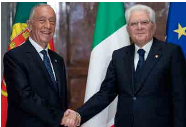
Il Presidente del Portogallo Marcelo Nuno Duarte Rebelo de Sousa con Mattarella

Il presidente della Repubblica italiana, Sergio Mattarella, che il 12 novembre scorso ha accolto al Quirinale il presidente portoghese Marcelo Nuno Duarte Rebelo de Sousa, a conclusione dell'incontro ha voluto confermare la posizione salda dell'Italia nella Nato. "Abbiamo anche parlato del ruolo che Portogallo e Italia - ha detto infatti - svolgono, insieme, nel rapporto transatlantico, ribadendo la fondamentale importanza dell'Alleanza e della Nato che, da decenni, è fonte di pace, di sicurezza e di benessere per l'Europa e per gli Stati Uniti"