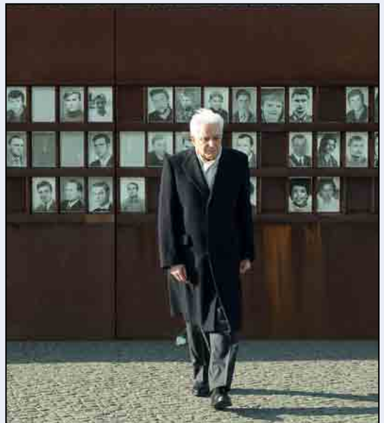
Il Presidente Mattarella quattro anni fa al "Memoriale del Muro di Berlino"

L'Europa senza più muri di divisione e di odio è una grande opportunità per consentire ai suoi cittadini di essere padroni del proprio destino e di metterlo a confronto, in un dialogo di pace, con le aspirazioni dei popoli e delle culture di altri continenti».