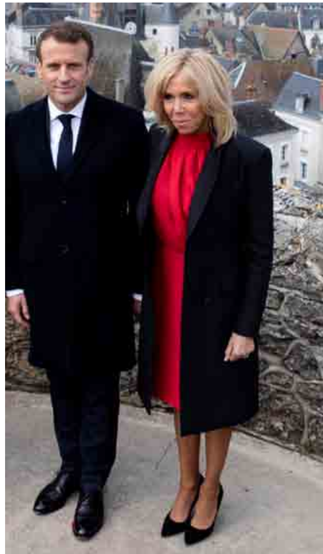
Emmanuel e Brigitte Macron

Naturalmente, nulla sarebbe semplice: le basi americane in Italia diventerebbero basi francesi, in quanto la Francia è potenza nucleare? E poi, fino a quando le bombe atomiche