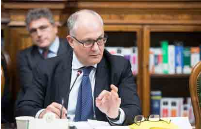
Roberto Gualtieri, ministro dell'Economia