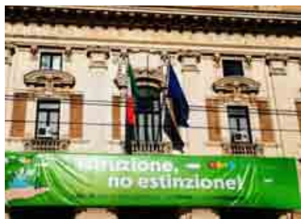
Il Miur a Roma