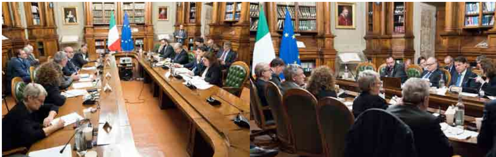
Incontro a Palazzo Chigi con i sindacati

ministro dell'Economia e della Finanze del governo Berlusconi IV, raccontò quanto successe allora, ricordando che fu la Bce a mandare a Palazzo Chigi il 5 agosto del 2011 una lettera-diktat, il cui senso era: se non fate quello che vi «consigliamo» non compriamo titoli del debito pubblico italiano causandone il default. Il Decreto legge approntato in pochi giorni dal governo però - ricorda Tremonti - "non conteneva alcuna clausola di salvaguardia, clausola che fu introdotta solo a seguito della successiva e strumentale insistenza «europea»". Aggiunge Tremonti nella sua ricostruzione: "Il sostanziale passaggio dal piano generico e programmatico al piano giuridico-vincolante mirato specificamente sull'Iva fu operato - caduto il Governo - dal Governo Monti che per primo introdusse il tipo di clausola che poi