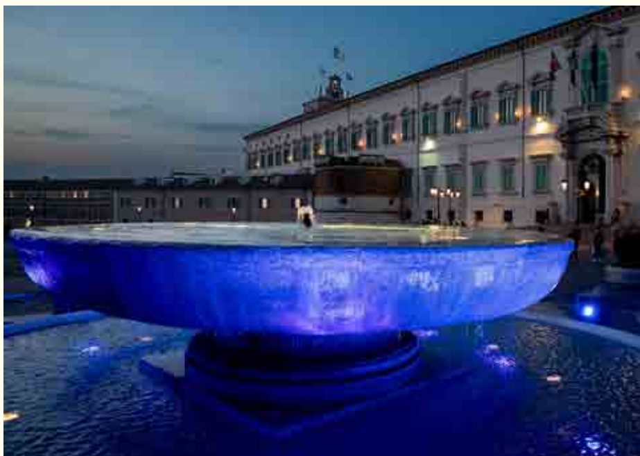
La fontana dei Dioscuri a Roma, davanti alla Corte Costituzionale

giudice che istruisce l'altro procedimento (Cass. sezione V civ. sent. 14 novembre 2012, n. 19859, 20 marzo 2013, n. 6918, 3 dicembre 2010, n. 24587, 22 maggio 2015, n. 10578; sezione III pen. sent. 24 settembre 2008-21 ottobre 2008, n. 39358, 28 ottobre 2015-18 gennaio 2016, n. 1628 e 23 ottobre 2018-5 dicembre 2018, n. 54379), chiedendosi infine la Corte "...per quale motivo l'irrogazione di una pena detentiva – destinata con ogni verosimiglianza, peraltro, a essere condizionalmente sospesa – risulterebbe sproporzionata rispetto alla gravità del reato (consistente, nella specie, nell'omissione del versamento di 282.495,76 euro dovuti a titolo di IVA), se combinata con la sanzione amministrativa già applicata (pari in concreto al 30 per cento dell'imposta evasa), con conseguente violazione del ne bis in idem nei confronti dell'imputato...".