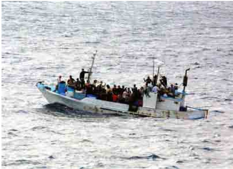
Una barca piena di migranti nel Mediterraneo