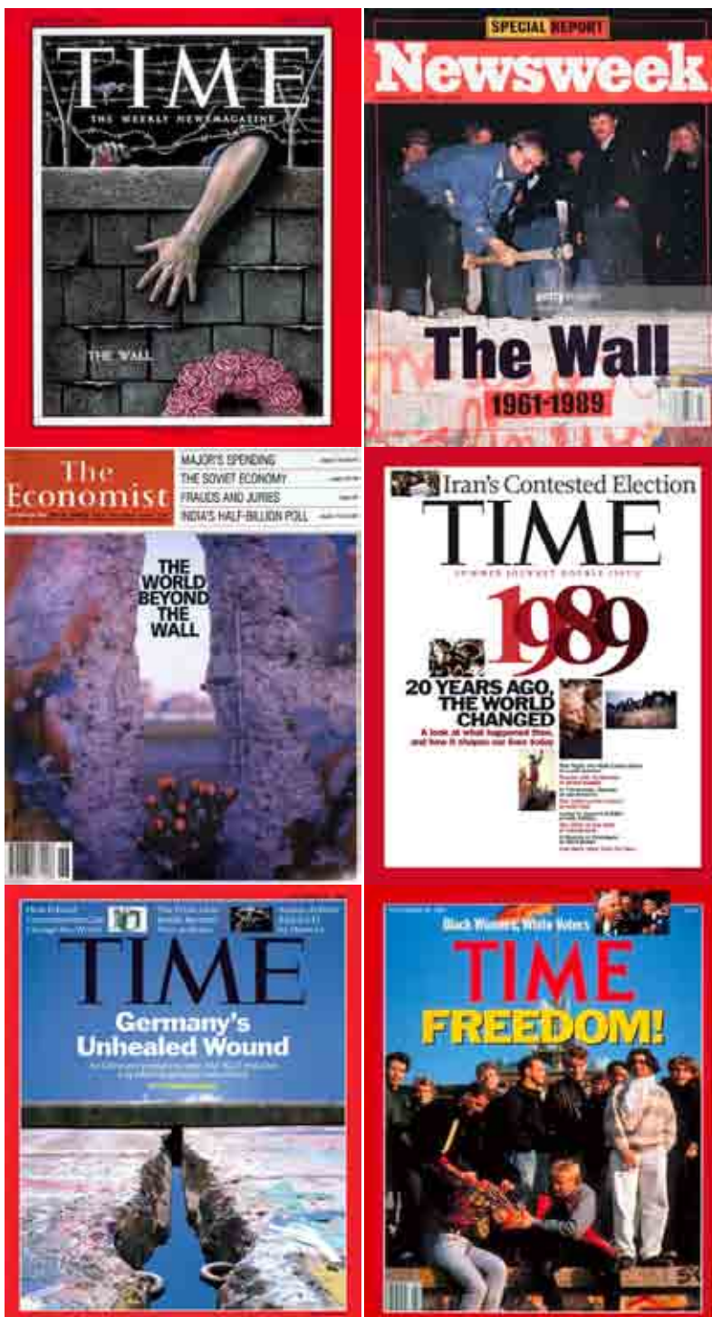
Il Muro di Berlino e la sua caduta nei grandi periodici

Anche se poi il primo partito è stato Die Linke (La sinistra), con oltre il 30% dei suffragi, ha fatto più effetto sulla stampa europea l'avanzata di Alternativa, che ha più che raddoppiato i consensi superando il 23% e ottenendo più consensi