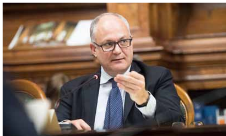
Roberto Gualtieri, ministro dell'Economia

ne sia incline a valutare con particolare attenzione i saldi finanziari esposti, per non dire nascosti, nel nostro più importante documento di finanza pubblica.