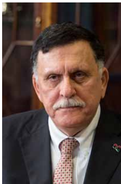
Fayed al Serraj

Essi hanno reiterato il loro fermo attaccamento all'unità, integrità territoriale, indipendenza, sovranità della Libia e all'obiettivo di una Libia stabile, sicura, democratica e prospera nell'interesse del popolo libico e dell'intera regione euro-mediterranea.