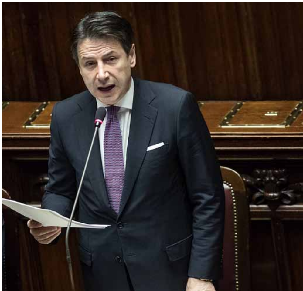
Il primo ministro Conte riferisce alla Camera sul fondo salva-Stati

governo. Il dibattito si è consumato tra i leader di partito sulle pagine dei giornali e nelle trasmissioni para-politiche in tv. Plastic tax e auto aziendali hanno monopolizzato parte del dibattito anche se erano misure marginali rispetto a un movimento di trenta miliardi, il valore complessivo della manovra. Che ha dovuto scontare, peraltro, la necessità di pagar pegno a misure di propaganda politica, come il cuneo fiscale alleggerito per i redditi più bassi. Una misura lodevole, ma con un difetto di prospettiva: l'Italia ha bisogno di