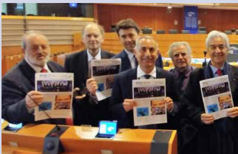
Più Europei al Parlamento europeo di Bruxelles

Finanziamenti dell'Unione Europea: crescita, occupazione e riforme per cittadini e regioni.