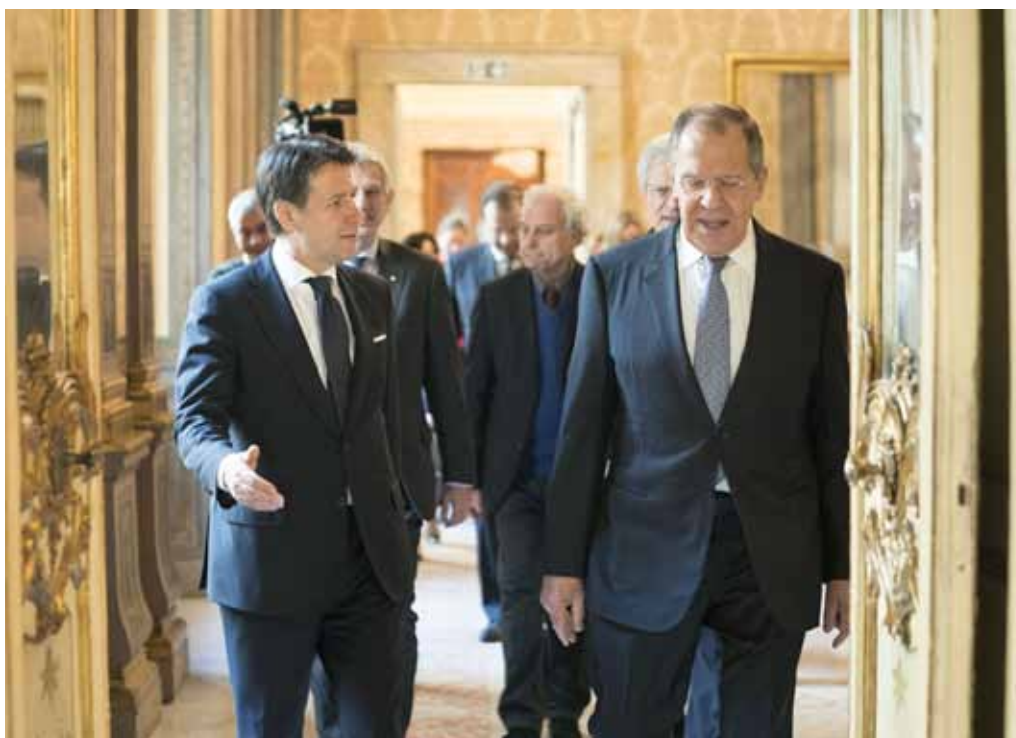
Giuseppe Conte e Sergej Lavrov il 6 dicembre scorso a Palazzo Chigi

il problema dell'Italia sul fronte della politica estera è altro. Prima di tutto, la mancanza di autorevolezza. Nei rapporti con la Russia la percezione - purtroppo non sbagliata, perché è stata spesso rimarcata esplicitamente dai nostri leader - è che ci sia una preoccupazione di carattere commerciale. Il che è vero e giusto, le sanzioni penalizzano le nostre esportazioni verso Mosca,