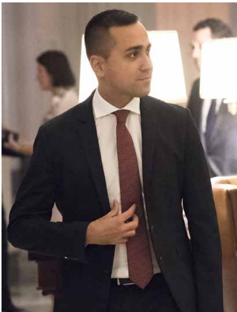
Il ministro degli Esteri Luigi Di Maio

Per sostenere Serraj, a capo di un fragile governo in crisi, a sorpresa si è offerta invece la Turchia, con un accordo militare. E la contrapposizione che si è delineata (Turchia con Serraj, Russia con Haftar) non è un'inimicizia improvvisa tra Ankara e Mosca, ma un suggerimento di quello che potrebbe avvenire in