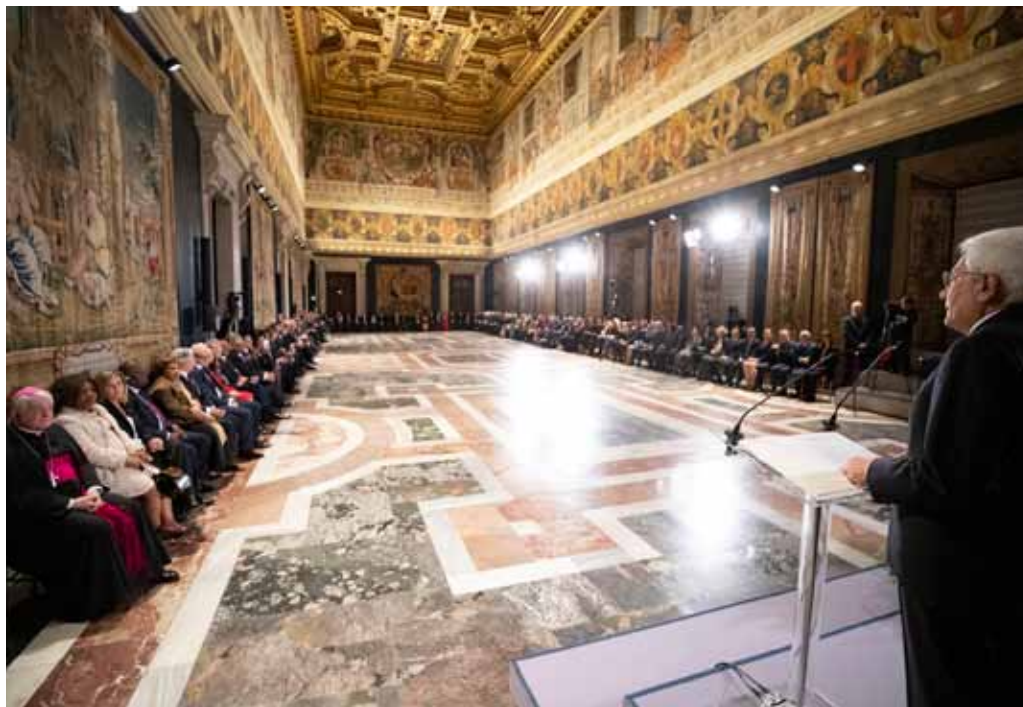
Il Presidente Mattarella parla nel Salone dei Corazzieri nel Palazzo del Quirinale

Mai - dalla firma dell'Accordo di Parigi ad oggi - l'attenzione della comunità internazionale, dei media, delle associazioni come di singoli individui riguardo la "salute" del nostro pianeta è stata così viva. La COP 25, appena conclusa, rappresenta, purtroppo, un esempio di quanta strada debba ancora percorrere la consapevolezza