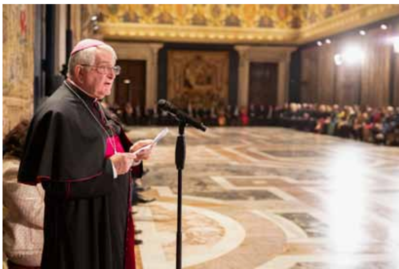
Il Decano del Corpo diplomatico e Nunzio Apostolico, Monsignor Emil Paul Tscherrig

Anche a voi - attenti osservatori delle relazioni internazionali - non sfuggirà, infatti, come sia diventato purtroppo uso corrente ricorrere al termine "guerra" per definire l'esistenza di un dissenso tra Stati, qualificandolo in vario modo: "guerra economica", "guerra commerciale", quasi ad attenuarne il significato. Al contrario, nulla affievolisce il significato del sostantivo "guerra" e ne ri-