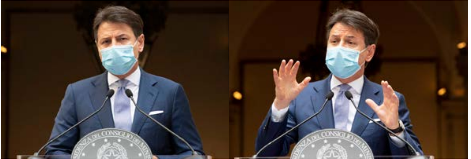
Il premier Giuseppe Conte parla con i giornalisti a Palazzo Chigi