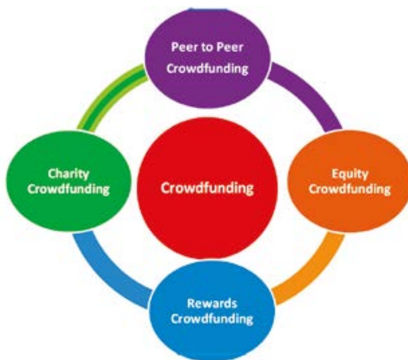
Principali tipi di Crowdfunding

di transizione, le normative nazionali sul crowdfunding saranno integralmente sostituite dal nuovo regime e i portali che non saranno autorizzati secondo le nuove regole non potranno più operare. Il nuovo regolamento dell'Unione Europea sul Crowdfunding è per molti versi simile all'attuale normativa italiana sull'equity crowdfunding, la prima regolamentazione del settore a livello mondiale. Detta forma di reperimento fondi, attraverso il prestito azionario, approvata tra il 2012 e il 2013, ha permesso finora ad oltre 500 startup e PMI italiane di raccogliere complessivamente più di 150 milioni di euro, grazie a migliaia di investitori che sono oggi soci di queste società. Ma cos'è il Crowdfunding? Il Crowdfunding è un modo innovativo di raccogliere denaro per finanziare progetti e imprese. Esso consente ad un fornitore di servizi di Crowdfunding (fundraiser) di gestire una piattaforma digitale aperta al pubblico