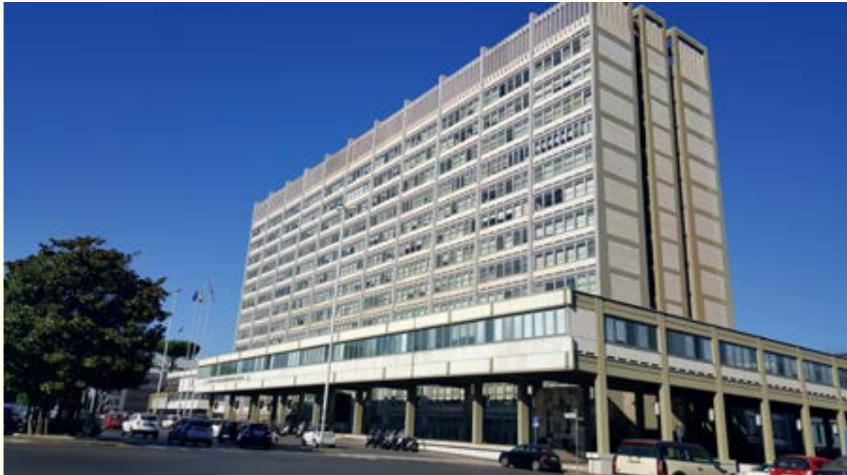
La sede centrale dell'Inps a Roma, al quartiere Eur.

nanza, dal momento che, per poter essere soggetti a imposizione in Portogallo, il requisito della residenza era sufficiente per i secondi, laddove i primi dovevano anche acquisire la cittadinanza portoghese. La sentenza ha preliminarmente ricordato che nell'ambito della procedura di cooperazione tra i giudici nazionali e la Corte istituita dall'articolo 267 TFUE, spetta a quest'ultima fornire al giudice nazionale una risposta utile che gli consenta di dirimere la controversia di cui è investito anche se fosse necessario riformulare le questioni sottoposte (CG, 3 marzo 2020, Gómez del Moral Guasch, C125/18). Ha poi ritenuto ammissibile il quesito (contrariamente a quanto sostenuto dai governi belga e svedese intervenuti nel giudizio) in quanto tutti i cittadini dell'Unione possono avvalersi del divieto di discriminazione basata sulla nazionalità sancito dall'articolo 18 TFUE nell'ipotesi in cui essi abbiano esercitato la libertà fondamentale di circolazione e di soggiorno sul territorio degli Stati membri conferita dall'articolo 21 TFUE (CG 13 novembre 2018, Raugevicius, C247/17, e