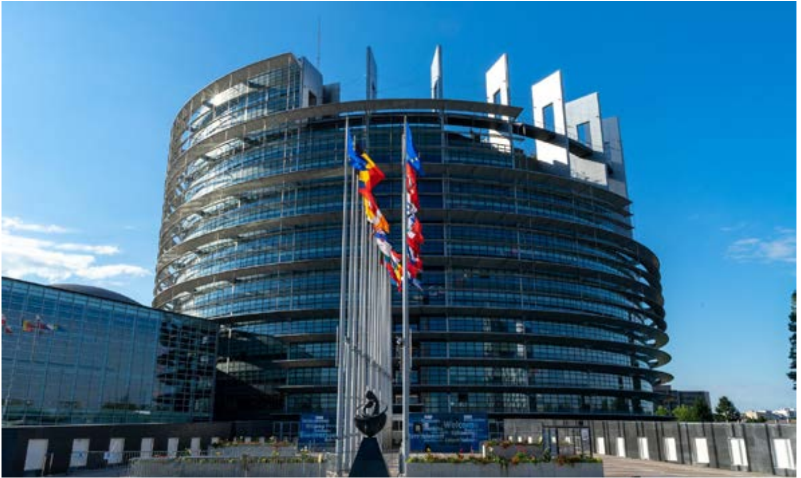
La sede del Parlamento europeo

utili proposti dal Kalergi era quello di solidificare sostanzialmente le potenzialità di una Europa forte, capace d'incidere sugli orizzonti internazionali dominati dalle potenze USA, URSS e dall'allora coloniale Regno Unito.