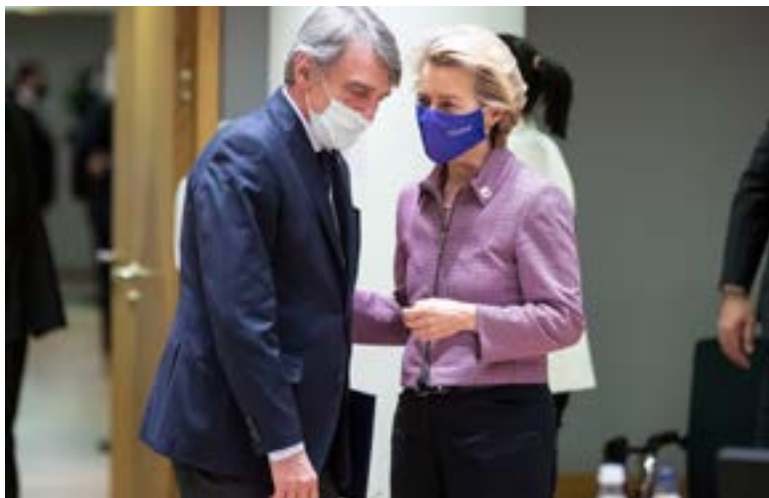
Il presidente dell'Europarlamento David Sassoli con Ursula von der Leyen

ficato solo questa dichiarazione di Nicola Zingaretti : "La preghiera che faccio a tutti è che per i prossimi 20-30 giorni bisogna diradare i contatti fra le persone. Per almeno un mese