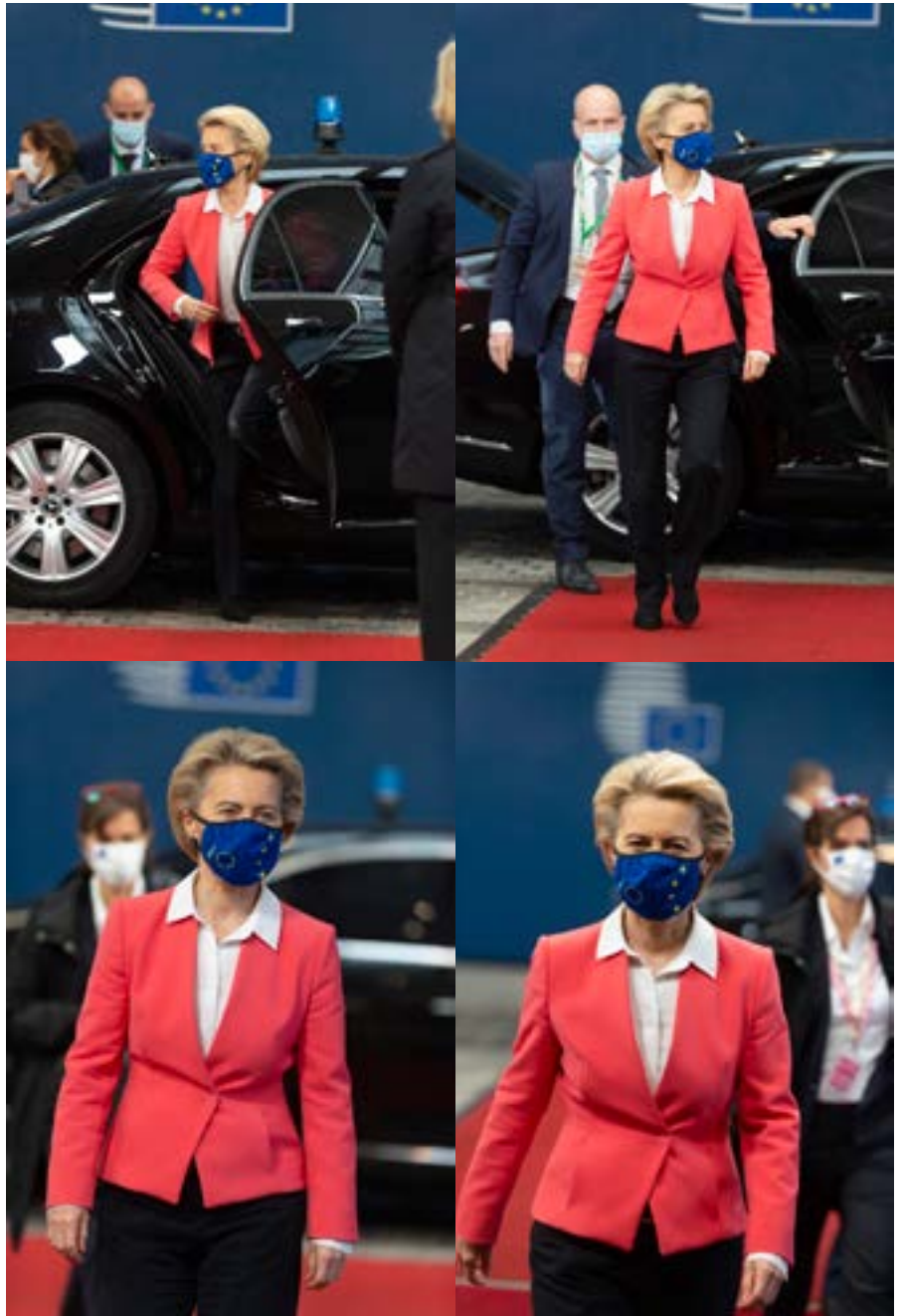
La Presidente della Commissione europea Ursula von der Leyen arriva a Bruxelles