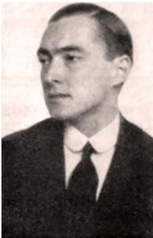
Richard Nikolaus von Coudenhove-Kalergi nel 1926

La metodologia più accreditata nelle operazioni intellettuali di storia del