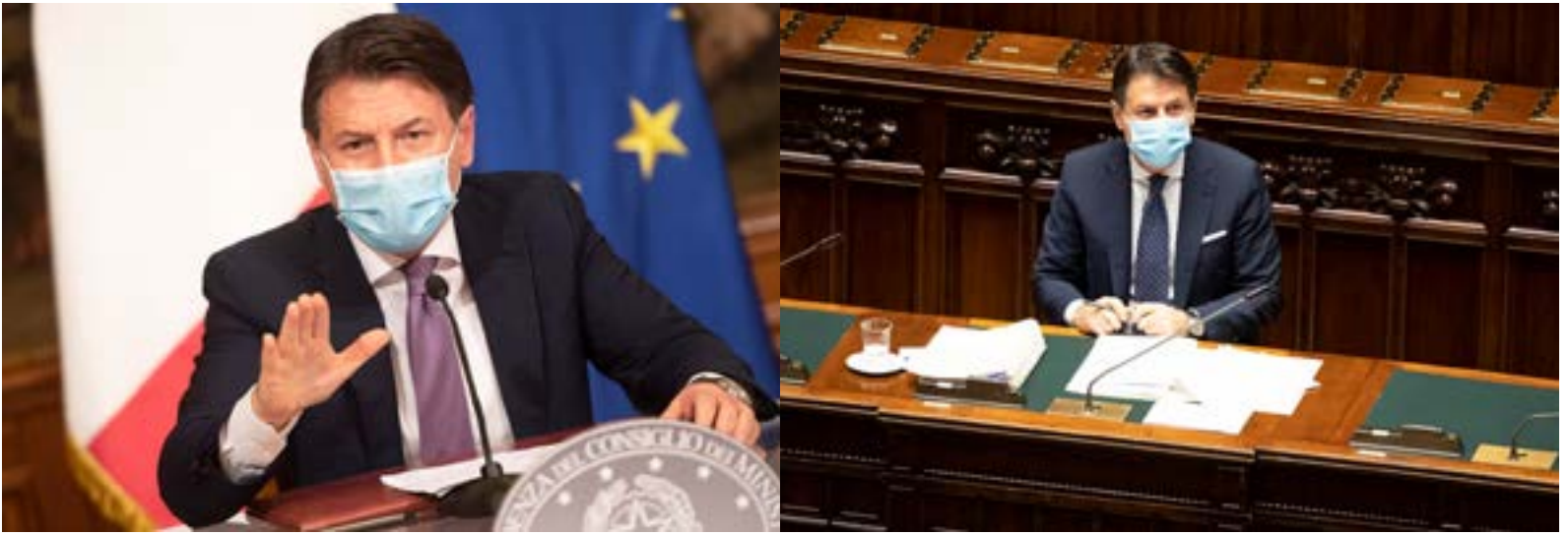
Giuseppe Conte illustra le nuove misure del governo italiano sul coronavirus