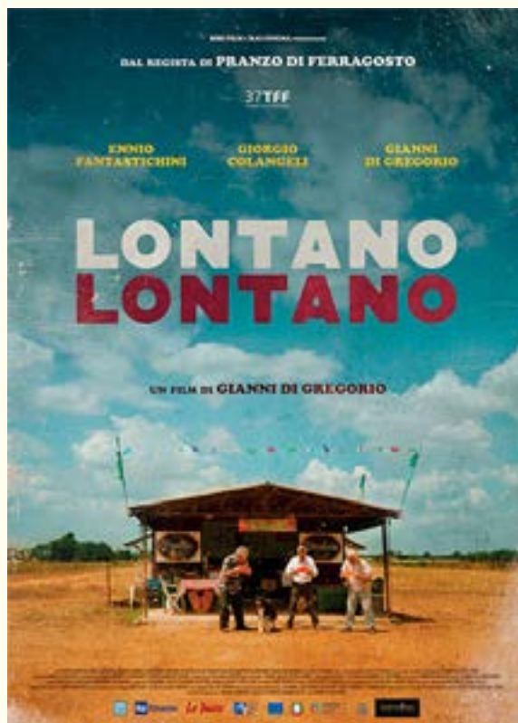
Il film che affronta il tema dei pensionati che vanno all'estero per pagare meno tasse

Parimenti, la designazione dello Stato debitore della pensione («Stato pagatore») come quello competente ad assoggettare a imposizione le pensioni riscosse dal settore pubblico non può avere, di per sé, ripercussioni negative per i contribuenti interessati, in quanto il carattere favorevole o sfavorevole