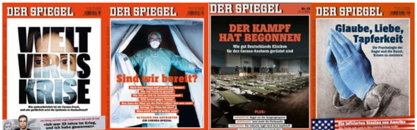
Il coronavirus nelle copertine del settimanale tedesco Der Spiegel

di sicurezza e/o utilizzando una mascherina (questo chiaramente non è possibile al bar, al ristorante o se si accetta un invito a cena). Questo significa rinunciare il più possibile a