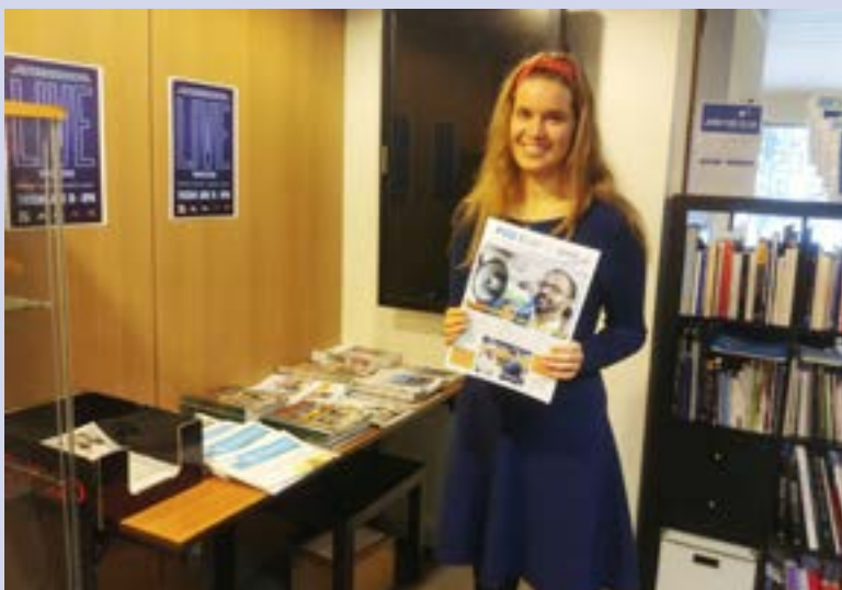
Più Europei al Press Club di Bruxelles