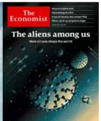
Il coronavirus nelle copertine del settimanale britannico The Economist